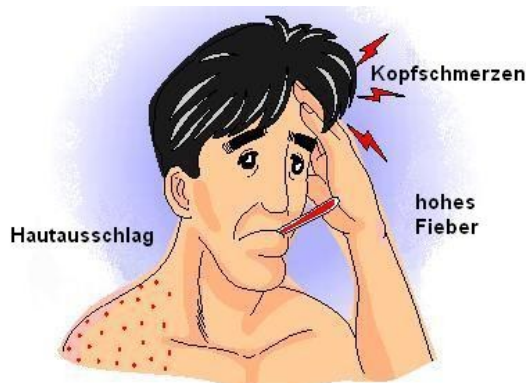
Abbildung 3 Symptome bei klassischem Denguefieber

Dengue tritt in zwei Formen auf. Üblich ist das klassische Dengue Fieber . Nach einer Inkubationszeit von drei bis zehn Tagen (vom Stich der Mücke bis zu den ersten Krankheitszeichen) kommt es zu hohem Fieber, Hautausschlag, starken Kopf-, Knochen- und Gliederschmerzen. Die Symptome sind unspezifisch und ähneln manchmal einer „Grippe“.