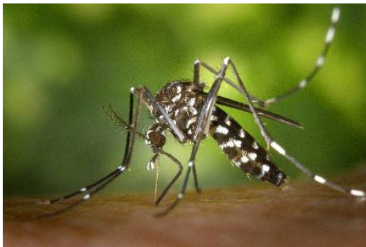
Abbildung 2 Aedes albopictus , die asiatische Tigermücke ist Hauptüberträger der Dengue Viren

Dengueviren werden von tagaktiven Stechmücken der Gattung Aedes übertragen (Abb. 2). Es gibt vier Varianten, die Subtypen DEN 1 bis 4, die alle die gleiche Krankheit auslösen. Sie leben in gern in den Städten. Deshalb kann es zu großen Ausbrüchen (Epidemien) kommen, wenn die Mücken in der Regenzeit zahlreicher werden. Ihre Larven entwickeln sich in Pfützen, leeren Dosen, Blumenvasen und Autoreifen, in Astgabeln und Blättern. Gärten, und Friedhöfe, Baustellen und Müllhalden sind günstige Biotope. Im Chlorwasser von Schwimmbecken überleben sie nicht.